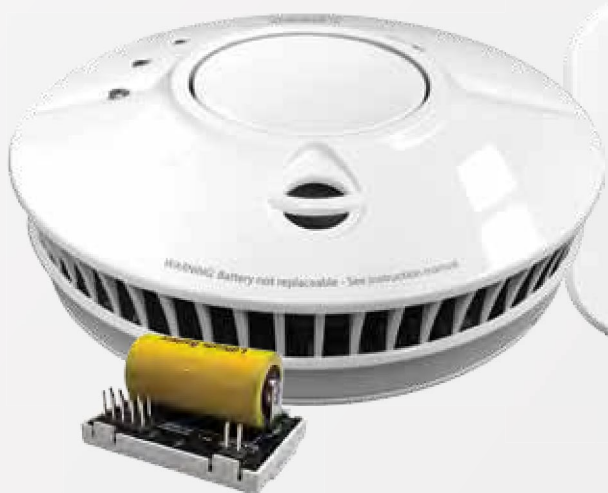
FireAngel rookmelder met Wi-Safe 2™ module