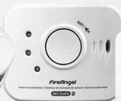
FireAngel koolmonoxidemelder met Wi-Safe 2™ module