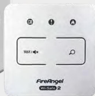
FireAngel locatieschakelaar Wi-Safe 2™